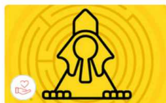
Санкт-Петербург Культурный квест