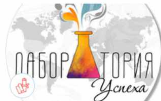
Республика Башкортостан Лаборатория успеха