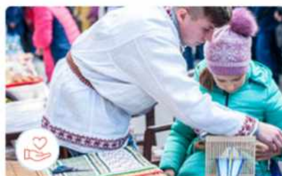
Липецкая область Возрождая традиции - помогаем детям!