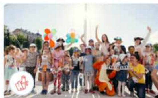
Я – ДоброТворец